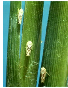
เพลี้ยจักจั่นปีกลายหยัก