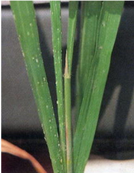
ลักษณะอาการของโรคหูด