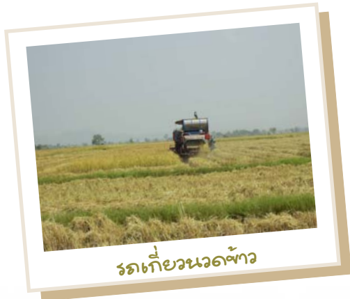
รถเกี่ยวนวดข้าว