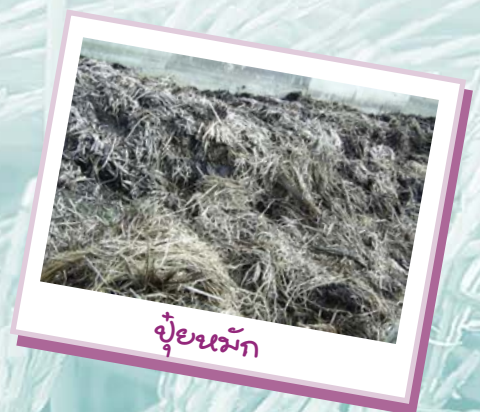
ปุ๋ยหมัก