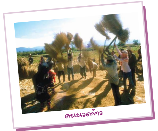
คนนวดข้าว