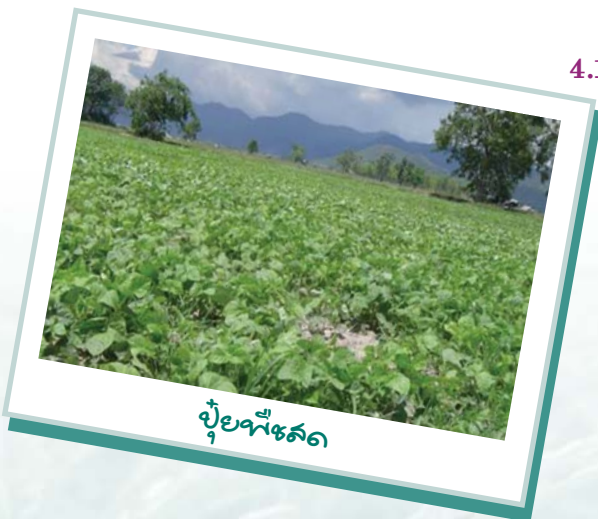
ปุ๋ยพืชสด