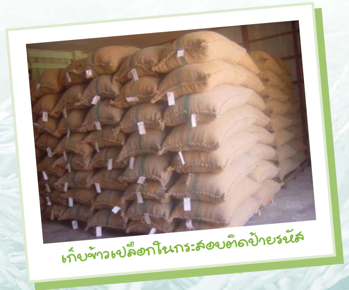
เก็บข้าวเปลือกในกระสอบปิดป้ายรหัส