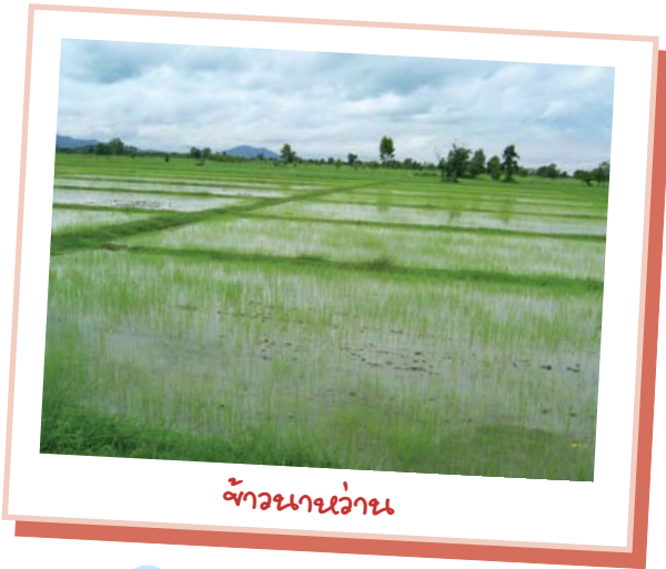
ข้าวหว่าน