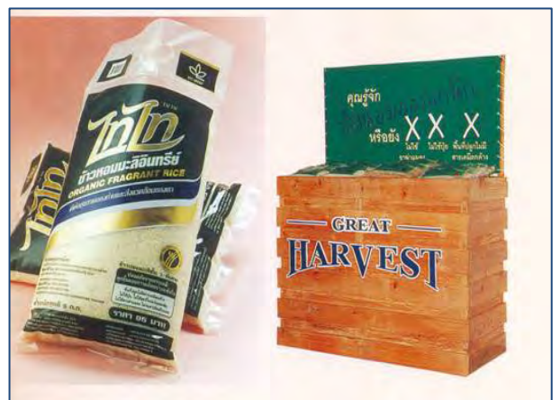
ผลิตภัณฑ์ข้าวอินทรีย์ที่ผ่านการแปรรูปเพื่อจำหน่าย