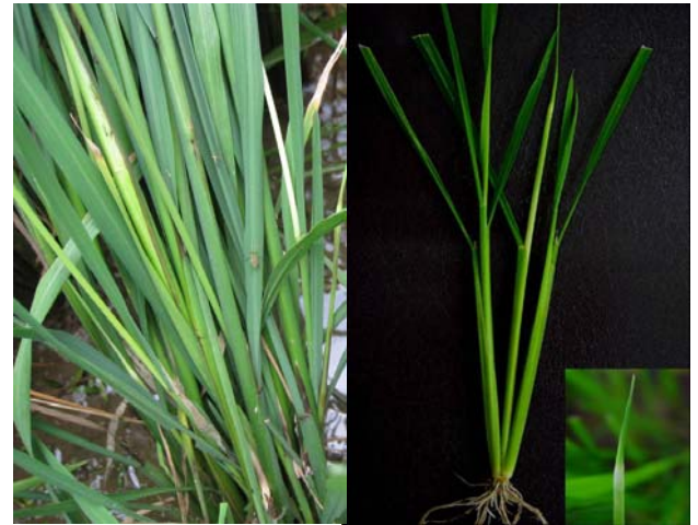
ลักษณะต้นข้าวที่แมลงบัวทำลาย (หลอดบัวหรือหลอดหอม)