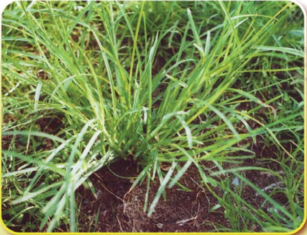
หญ้าตานก