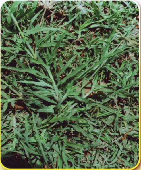
หญ้าปากคาง