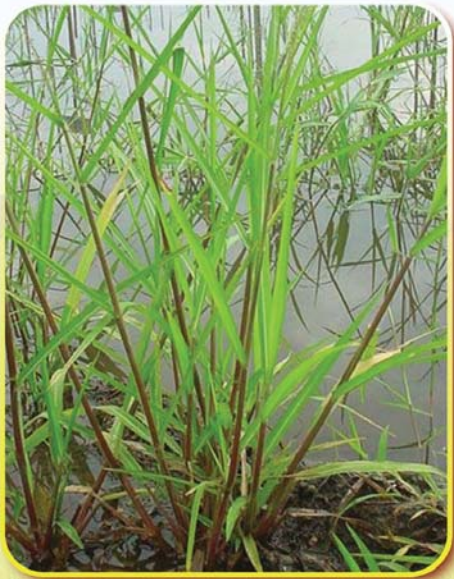
นกกอกปลา