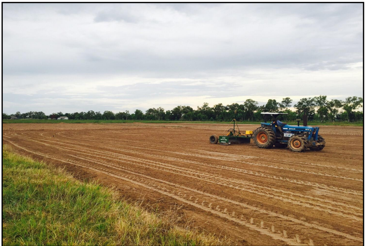
ภาพการปรับระดับดินนาด้วยระบบ Leser